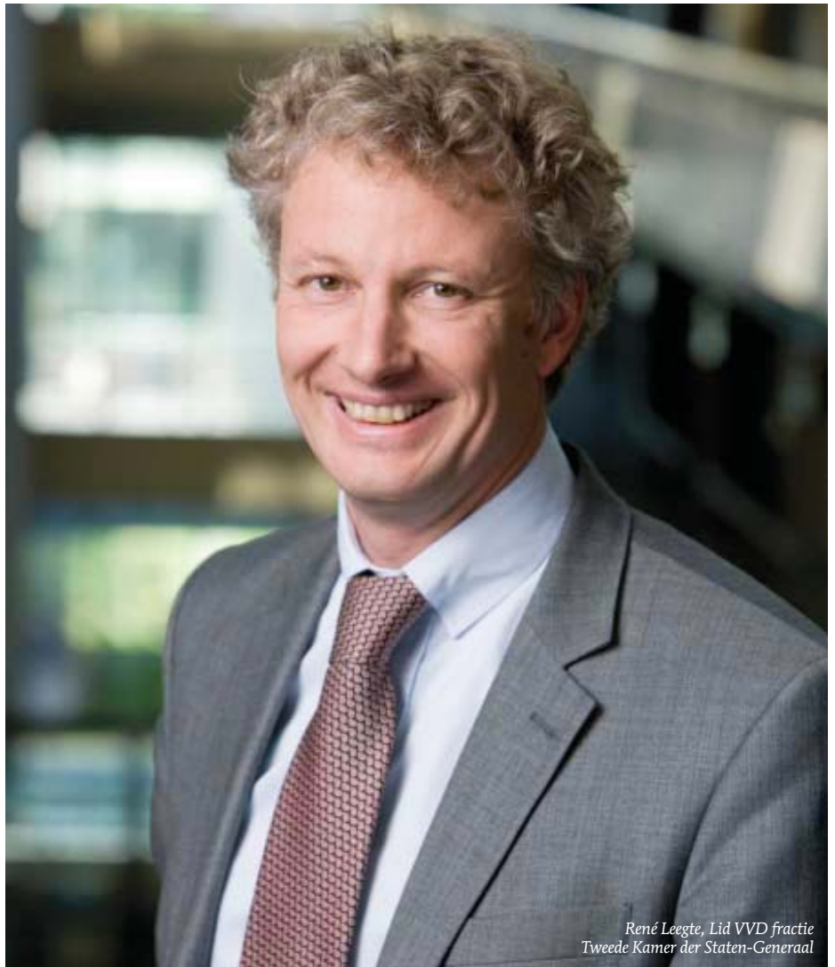
René Leegte, Lid VVD fractie Tweede Kamer der Staten-Generaal

"Door het begrip 'Directe Lijn' toe te voegen aan de Nederlandse regelgeving ontstaat duidelijkheid over de rechtspositie van geïsoleerde energieproducenten. Hierbij moet je denken aan producenten met een eigen WKK-installatie of industrie-