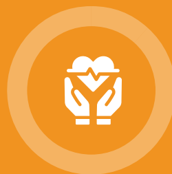
Ziekenhuizen en overige zorginstellingen