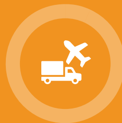
Vervoer en opslag