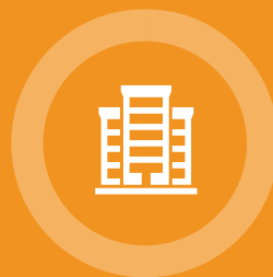
Gebouwde omgeving en ICT